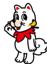
広島広域都市圏マスコットキャラクター ひろしま都市犬はっしー